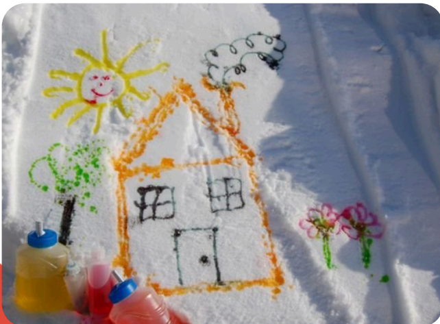
Maman pour la vie